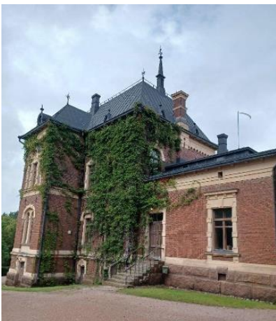
Malmgårdin kartano Loviisassa

Kymenseudun Kotien Puolesta ry. on järjestänyt toimintaa lähes joka kuukausi. Kerhossamme on vierailut kotkalaisia kirjailijoita, sekä luennoitsijoita terveyden edistämiseksi.