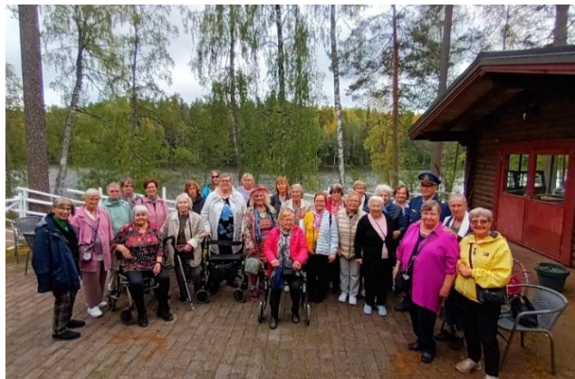
Vallilan Kotien Puolesta väkeä Marskin majalla